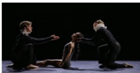
Ballet Prejocaj Pavillon Noir Grande Halle de la Vilette

Le spectacle vivant : un secteur composite, dynamique et innovant