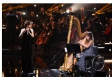
Victoire de la musique 2025