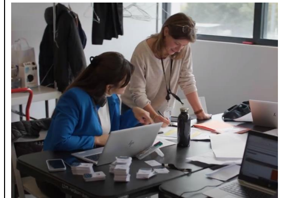
@ La Seine musicale