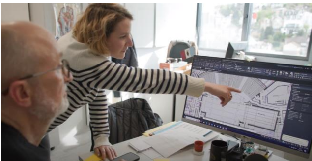
Event manager @ La Seine musicale

Mais un vif intérêt pour l'art et la culture est primordiale.