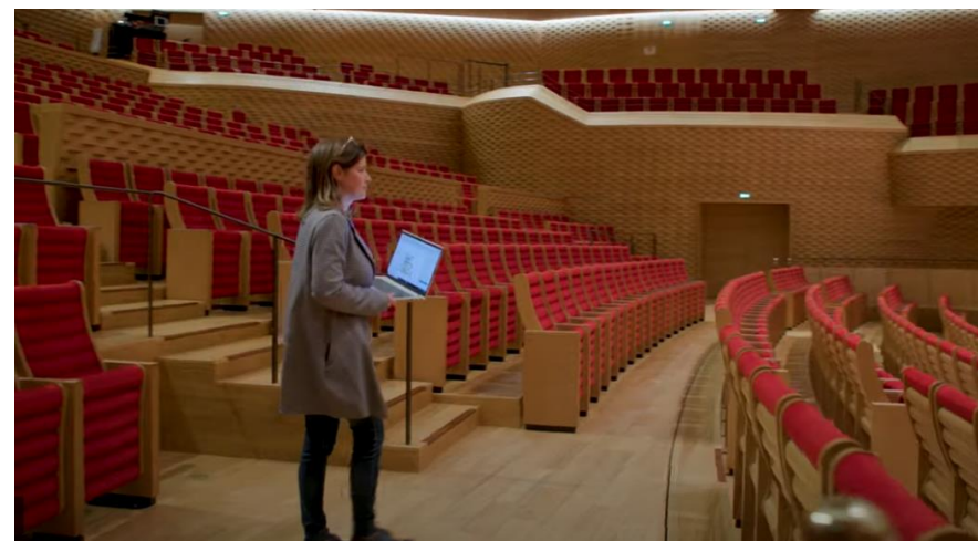
Responsable de production @ La Seine musicale

Série Fiches d'orientation Les personnels administratifs du spectacle vivant Réalisation : CPNEF-SV Edition : Observatoire prospectif des métiers et des qualifications du spectacle vivant