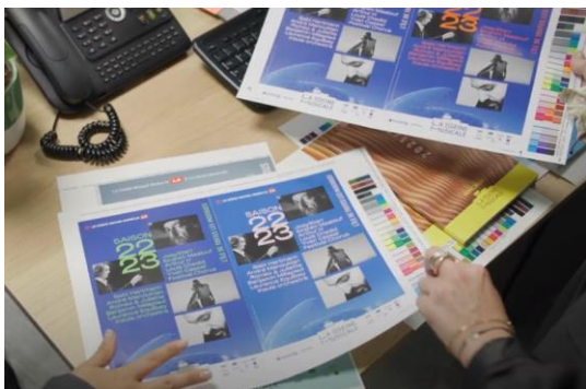
Préparation d'un support de communication @ La Seine musicale

Conditions de travail, variant selon les métiers : travail en équipe et coactivité, missions diversifiées en fonction du type de spectacle, planning à respecter, horaires irréguliers et parfois décalés, dans les bureaux sur la préparation mais aussi sur le terrain (plateaux, loges, ateliers...), déplacements, temps de travail variable et emploi discontinu (pour les salariés en CDD et CDDU).