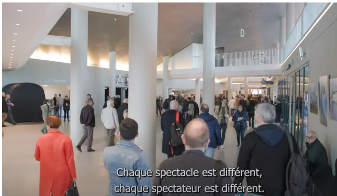
Accueil du public @ La Seine musicale