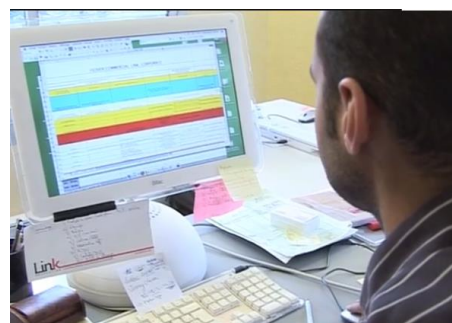
Chargé de production